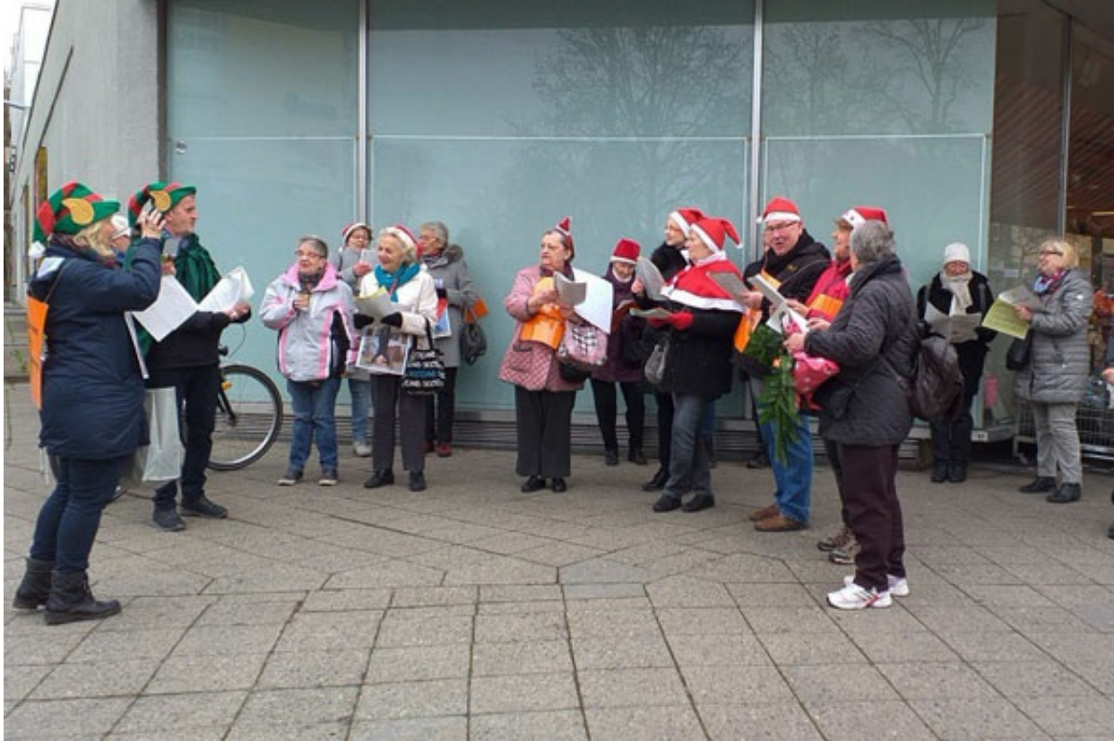
Flashmob in Lichtenrade

Senior*innen in Bewegung. Am 11. Dezember haben sich Mitarbeiter*innen des Bezirksamtes und die Seniorenvertretung in der Bahnhofstraße getroffen und mit Flyern auf Projekte im Bezirk aufmerksam gemacht. Sport und Bewegungsangebote werden zum Beispiel von allen Seniorenfreizeitstätten angeboten. In Bewegung bleiben - nicht nur sportlich gemeint - und damit gesund alt werden, dazu sollte stimuliert werden. Zum Abschluss wurden, dem Advent entsprechend, Weihnachtslieder gesungen.